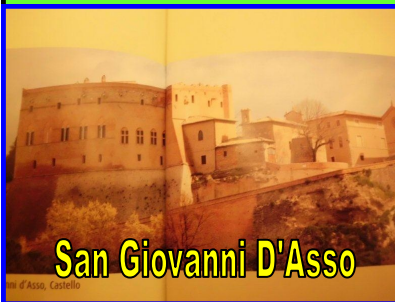
San Giovanni D'Asso

Giovedì 1 novembre 2012 ritrovo a San Giovanni D'Asso località Montisi (SI) area di sosta via Degli Ortali vicino impianti sportivi. 13° edizione della Festa "IL PRIMO OLIO" andar per Frantoi e Mercatini. Sera ore 20.30 circa cena presso la Contrada La Torre nel castello "LA GRANCIA". Menù car-