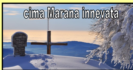
cima Marana innevata