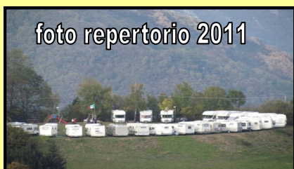
foto repertorio 2011