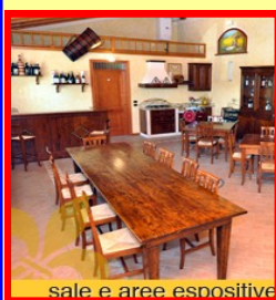
sale e aree espositive

asettica, composta da: impianto di microfiltrazione, una riempitrice isobarica per imbottigliare vini fermi, frizzanti e spumanti, tappatore, capsulatrice ed etichettatrice. L'impianto è in grado di confezionare qualsiasi tipo di bottiglia con la possibilità, inoltre, di personalizzarla. Vini piacevoli e di ottima qualità, pensati per il consumo quotidiano. Corte del Tiglio Vini frizzanti e spumanti. Freschi, briosi e leggeri. Per tutti i gusti.