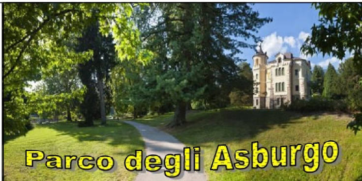
Parco degli Asburgo

E' il più grande parco storico della provincia autonoma di Trento , esteso su un'area verde di 14 ettari accessibili liberamente tutto l'anno a pedoni e biciclette nei 10 ettari destinati a verde pubblico, a ridosso del centro storico di Levico Terme . Questa é una ridente cittadina-giardino collinare e lacustre di disegno asburgico (situata a pochi km dalla città di Trento), entrata già dall'Ottocento nel circuito dei centri termali europei per le sue acque arsenicali-ferruginose terapeutiche , uniche in Italia e rare in Europa. Visita con guida Dt Nicola Curzel A.P.T. Levico