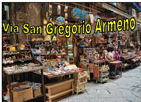
Via San Gregorio Armeno