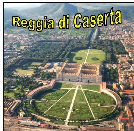
Reggia di Caserta