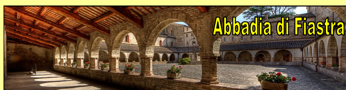
Abbadia di Fiastra