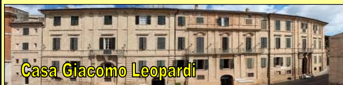
Casa Giacomo Leopardi

Martedì 23 aprile 2019: Al Mattino partenza con direzione Macerata con tappa a Recanati (MC) al parcheggio di Viale Nazario Sauro, 13, fronte Banca Intesa San Paolo, per visita guidata alla casa di Giacomo Leopardi , via Leopardi 14; con pranzo sul posto. Pomeriggio ore 14:15 ritrovo in piazza Nazario Sauro per visita guidata dello Sferisterio e al Centro Storico di Macerata . I Camper verranno parcheggiati in Via Virgilio Paladini Morica, a circa 200 mt. dallo Sferisterio . Al termine delle visite guidate trasferimento presso l'area sosta camper di Fiastra.