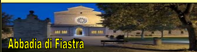
Abbadia di Fiastra

Mercoledì 24 aprile 2019: Mattinata libera. Pranzo presso l'area sosta camper di Fiastra in Contrada, 10; ore 14,30 per visita all'Abbadia: La riserva naturale dell' Abbadia di Fiastra (MC) è situata nel cuore sia delle Marche che della fascia medio - collinare della provincia di Macerata fra i 130 ed i 306 m. Si trova nei comuni di Tolentino (MC) e Urbisaglia (MC) . Pernottamento.